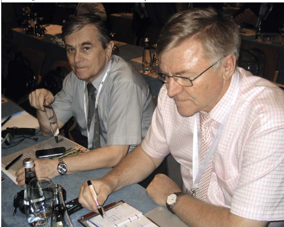
Čeští delegáti na Valném shromáždění Družstev Evropa

S dílčí informací k členským otázkám vystoupila zástupkyně ředitele Agnes