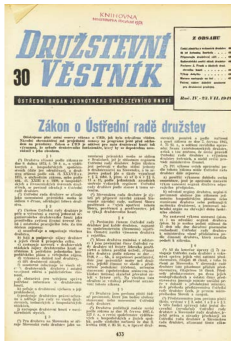
Zákon o Ústřední radě družstev

Na první schůzi Ústřední rady družstev, která se konala 17. 5. 1945 se sešli zástupci všech stávajících svazů, tj. Svazu spotřebních družstev, Svazu zemědělských družstev, Všeobecného svazu (zastřešujícího družstva výrobní, pracovní, živnostenská) a Svazu bytových podniků. Všechny družstevní organizace měly být nadále budovány jako organizace nezávislé na politických stranách, s dobrovolným členstvím a demokraticky voleným vedením. Zvláštní komise vypracovala návrh zákona o Ústřední radě družstev, který byl již v srpnu 1945 předán ministru práce a sociální péče. Ke schválení zákona však došlo až 25. 7. 1948, kdy jej podepsal prezident Klement Gottwald. Podle zákona č. 187/1948 z 1. srpna 1948 se stala Ústřední rada družstev představitelkou jednotného