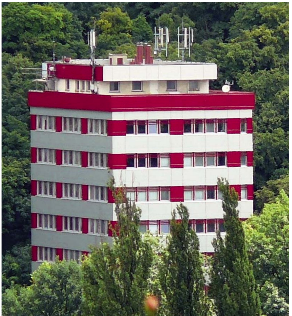
Budova sídla Svazu českých a moravských bytových družstev

Svaz řídí představenstvo, volené ze zástupců jednotlivých regionů. Ke své činnosti je vybaven nezbytným pracovním aparátem složeným z odborníků na bytové otázky, hospodaření družstev a právní a technickou problematiku, která s bydlením sou-