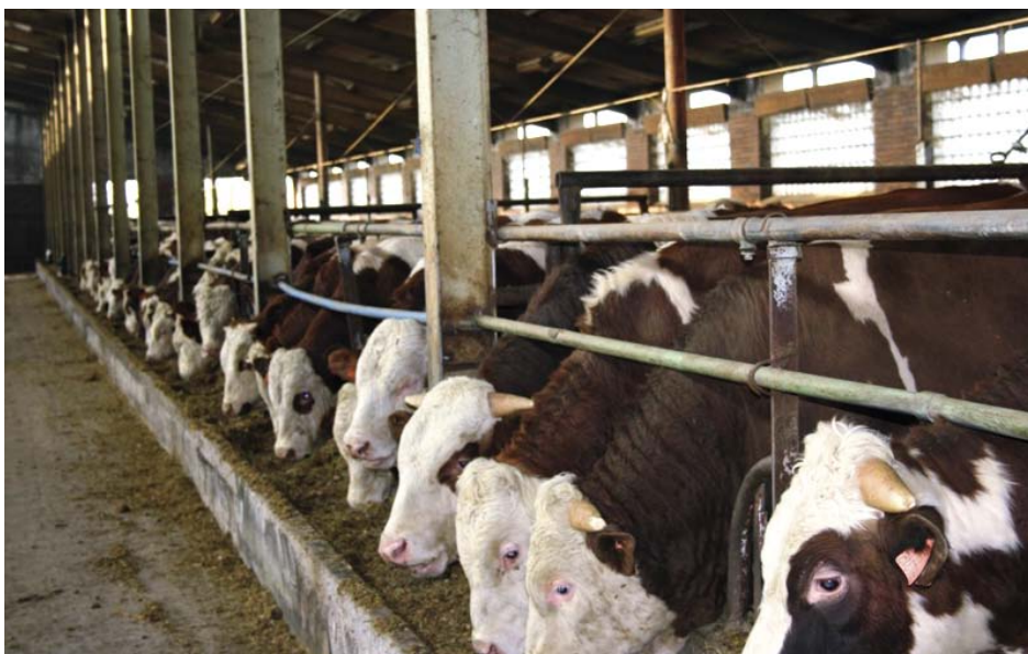
Chov býků ve Velkých Pavlovicích

V nástinu bych čtenáře tohoto textu rád seznámil se svými postřehy v oblasti problematiky zemědělství. Je to obor, který byl v poslední době politicky vnímán jako něco na okraji a méně důležitého. Troufám si však říci, že v dalších letech dojde k po-