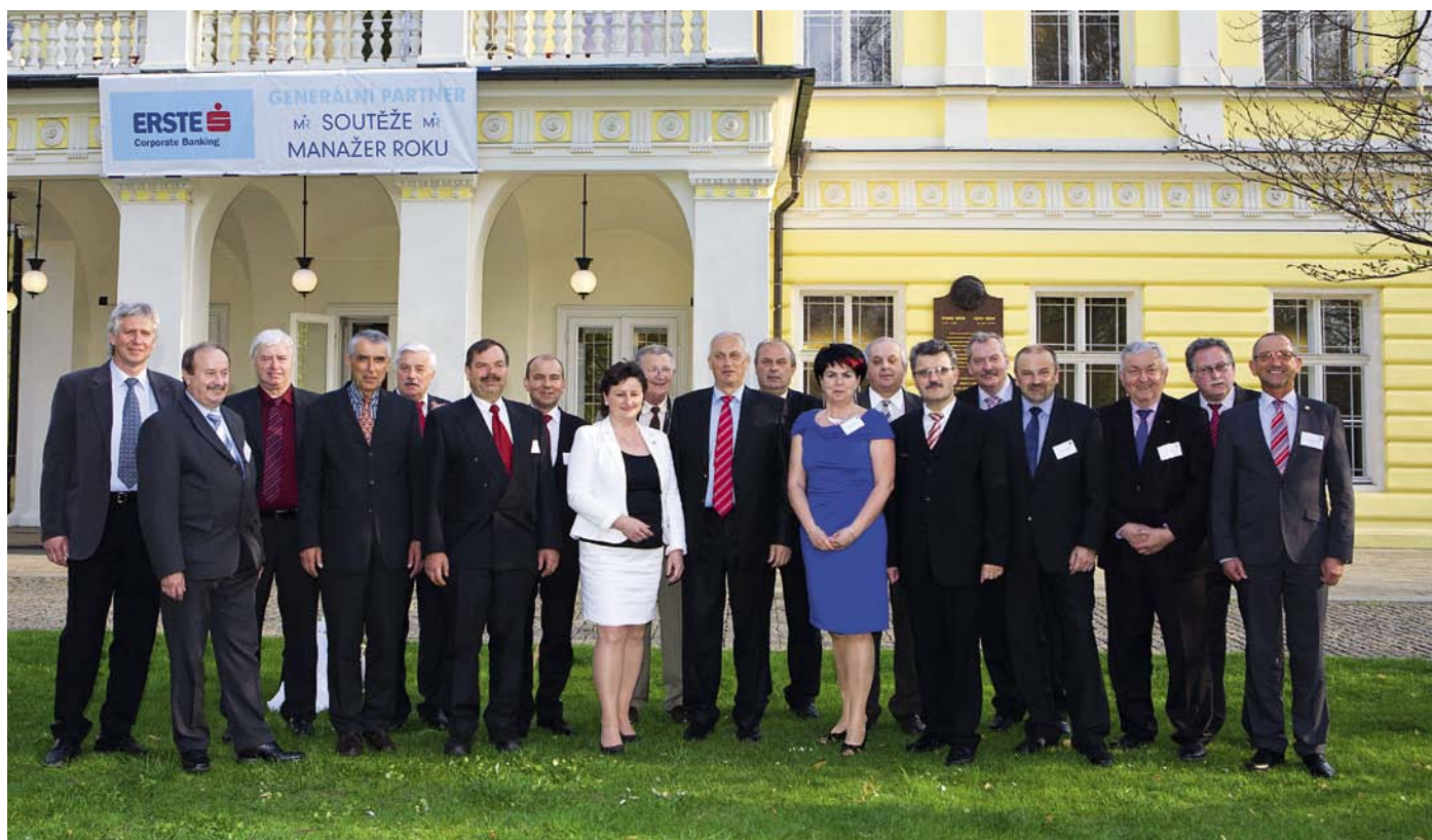
Úspěšní manažeři a manažerky, nominovaní ZS ČR, za posledních 10 let před palácem Žofín, kde je tradičně, tentokrát za účasti prezidenta ČR, soutěž vyhodnocována

argumentů a údajů na přihlášce, ale zejména, že tyto informace jsou prověřovány a posuzovány v praxi přímo „na místě samém“, a to např. formou manažerského auditu na pracovišti s povinností vidět veškeré provozy podniku. Jde o neverbální komunikaci (to, co vidím, obsahuje podstatně více informací než to, co slyším), která vypovídá daleko více (cca 80 %) než komunikace verbální. Když procházím s hodnoceným manažerem provozy podniku a zaznamenávám např. pořádek na pracovišti, reakce spolupracovníků atd. atd., dá se s velkou mírou přesnosti posoudit atmosféra, týmová práce, metody řízení v podniku, celkově tedy manažerský styl a přístup hodnoceného k řízení věcí, k řízení lidí, k řešení problémů atd.