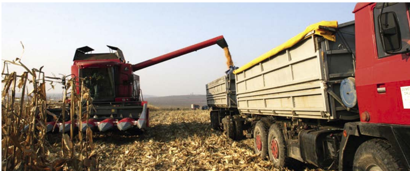
Sklizeň kukuřice na zrno ve Velkých Pavlovicích

V současné krizi, kdy se zvyšuje nezaměstnanost a stále více firem je posíláno do konkurzu, se ukazuje zajímavá myšlenka. V daném případě, kdy se firma dostane do konkurzu, konkurzní správce rozprodá majetek po dílčích částech, většinou pod hodnotou, a věřitelé splácou nad potenciální možností úhrady své pohledávky, neboť po takovém rozprodeji, úhradách odměn správce konkurzní podstaty a podobných zůstává velmi malá část pro věřitele, mnohdy i pod 10 procenty své původní přihlášené pohledávky. Po takovém zásahu správce již nebývá možnost pokračování firmy v podnikání a dochází k propouštění zaměstnanců. V § 316 reorganizace zákona č. 182/2006 Sb., insolvenční zákon, v případě reorganizace se rozumí zpravidla postupné uspokojování pohledávek věřitelů při zachování hospodaření tohoto podniku podle insolvenčním soudem schváleného reorganizačního plánu s průběžnou kontrolou jeho plnění ze strany věřitelů.