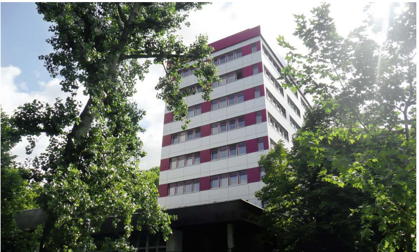
Budova sídla Svazu českých a moravských bytových družstev

Další výraznou aktivitou ekonomického oddělení byla pomoc družstvům při vedení běžného účtu, zhodnocování volných finančních prostředků a poskytování úvěrů. K tomu máme uzavřeny smlouvy o spolupráci s Sberbank CZ (dříve Volksbank CZ), Československou obchodní bankou, Wüstenrot stavební spořitelnou a bankou a JaT bankou.