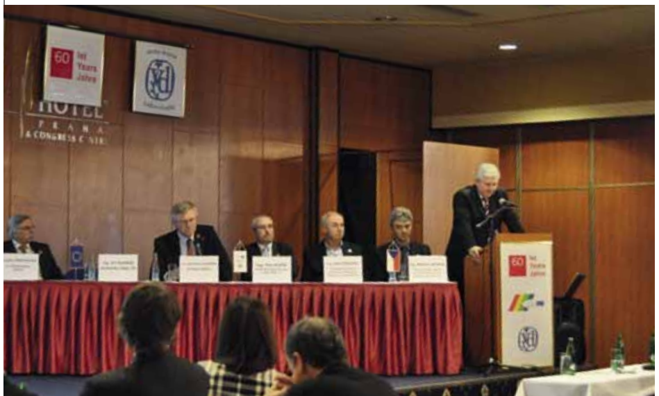
Celorepubliková porada SČMVD – vystoupení předsedy vlády ČR