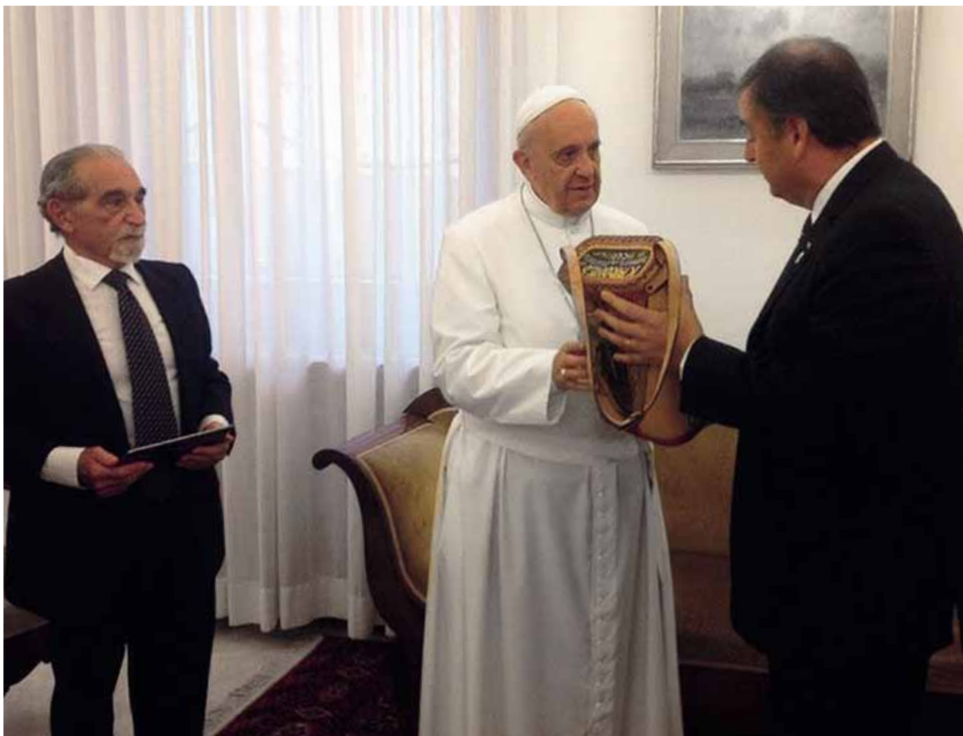
Předání daru papežovi

František svou podporu družstvům, která vnímá jako rozhodující prvek světové ekonomiky budoucnosti. Připomenul jejich roli v současné ekonomické krizi, kdy lidé umírají hladem a zimou a kdy i v zemích vnímaných jako silně rozvinuté, jakými např. jsou Španělsko a Itálie, dosahuje nezaměstnanost mládeže 40 %. Vzpomenul i na svého otce, který již r. 1945 diskutoval o vlivu družstev na místní komunity.