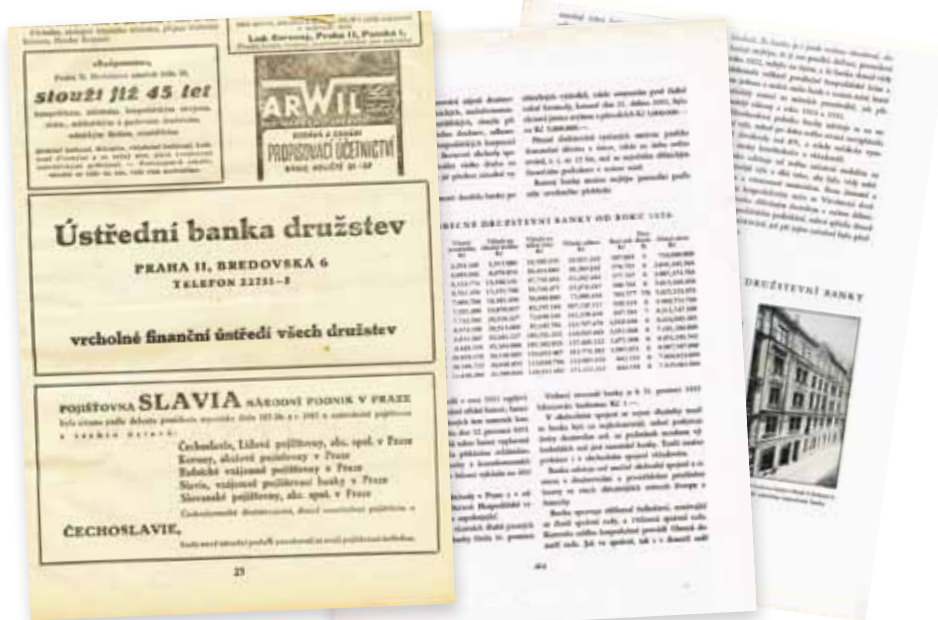
Leták družstevní banky v tisku; Statistický přehled banky v letech 1920–1932 (tabulka uprostřed); Budova Všeobecné družstevní banky v Brně, U Solnice 3.

Čerpáno z dokumentace Muzea družstevnictví a dále z publikace: Juřík, Pavel, Historie bank a spořitelén v Čechách a na Moravě, Libri, Praha 2011.