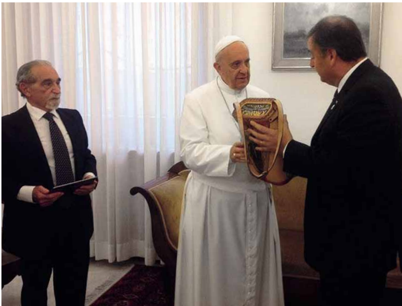
Předání daru papežovi

František svou podporu družstvům, která vnímá jako rozhodující prvek světové ekonomiky budoucnosti. Připomenul jejich roli v současné ekonomické krizi, kdy lidé umírají hladem a zimou a kdy i v zemích vnímaných jako silně rozvinuté, jakými např. jsou Španělsko a Itálie, dosahuje nezaměstnanost mládeže 40 %. Vzpomenul i na svého otce, který již r. 1945 diskutoval o vlivu družstev na místní komunity.