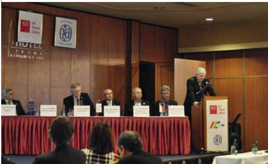
Celorepubliková porada SČMVD – vystoupení předsedy vlády ČR