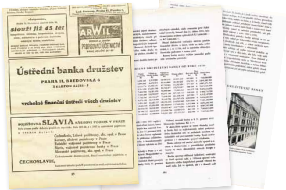
Leták družstevní banky v tisku; Statistický přehled banky v letech 1920–1932 (tabulka uprostřed); Budova Všeobecné družstevní banky v Brně, U Solnice 3.