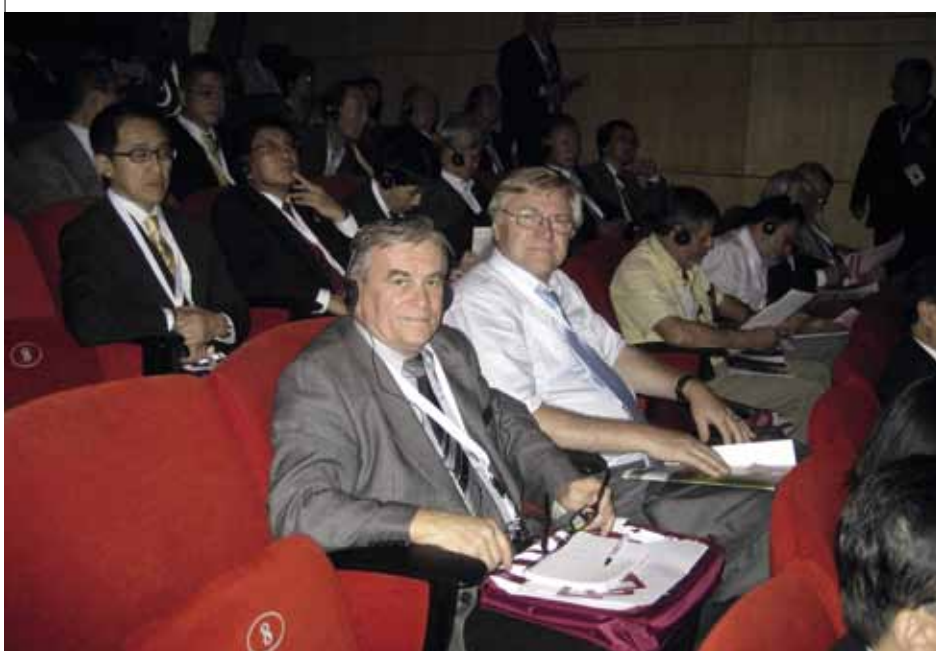
VS MDS – členové české delegace

V době od 11,00 do 12,30 pokračovalo (z předchozího dne) jednání tří pracovních seminářů, které byly