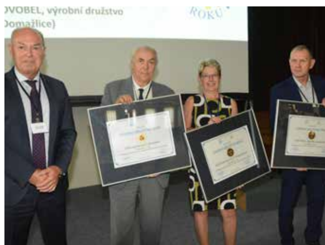
Výrobní družstvo roku 2022

Více informací o aktuální činnosti Svazu českých a moravských výrobních družstev je možné získat z časopisu Výrobní družstevnictví , na webových stránkách www.scmvd.cz , případně se lze obrátit přímo na jeho odborné pracovníky.